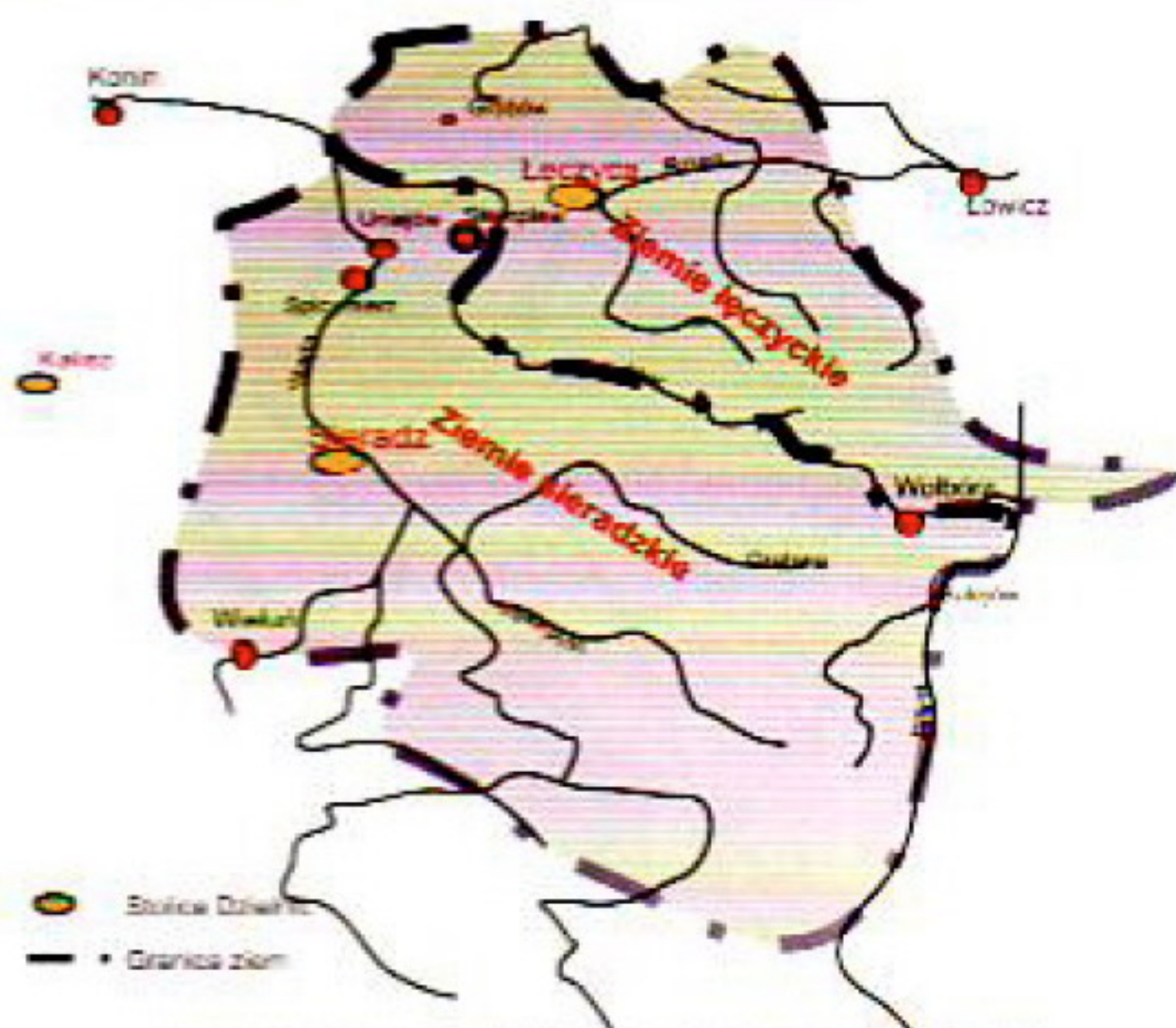
Ziemia łęczycko sieradzka w XIII i XIV w. za panowania Leszka Czarnego

W 1260 roku przeciwko ojcu Kazimierzowi Konradowiczowi zbuntował się jego syn z drugiego małżeństwa Leszek Czarny, w następstwie czego doszło do podziału księstwa łęczyckiego na dwie części. W wyniku ugody Leszek Czarny otrzymał południową część księstwa łęczyckiego ze stolicą w Sieradzu, zaś północna część ze stołeczną Łęczycą wróciła w ręce ojca. Od tego momentu można mówić o istnieniu odrębnych księstw: łęczyckiego i sieradzkiego, które z biegiem czasu określano mianem ziem, by w końcu XIV wieku nadać im nazwę województw. Granicę między województwem łęczyckim i sieradzkim stanowiły dolna i średnia Wolbórka oraz rzeka Ner. Zatem wsie obecnej gminy Świnice Warckie wchodziły wówczas w skład księstwa sieradzkiego, kasztelanii spicymirskiej w starostwie szadzkowskim.